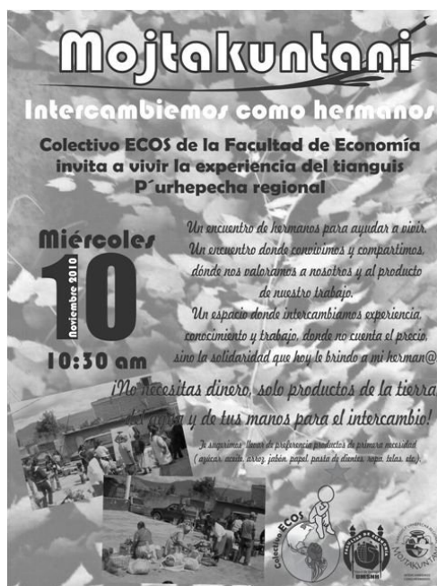
Figura 2. Ventajas de participar en el mojtakuntani .