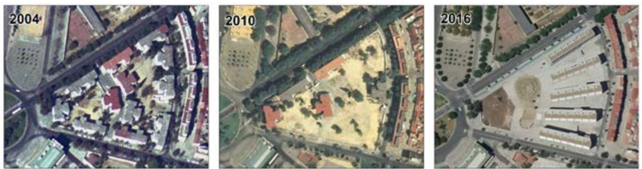
Figura 2. Secuencia del proceso de renovación urbana de Nuevo Amate