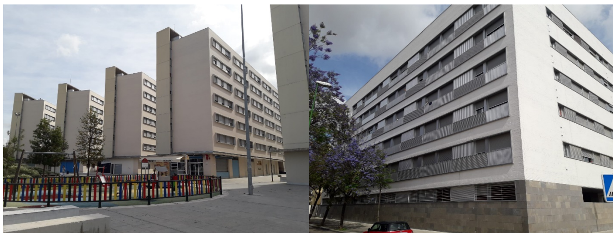
Figura 4. Edificios de Nuevo Amate (antiguas Regiones Devastadas)