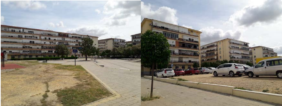
Figura 5. Edificios rehabilitados en la barriada Parque Alcosa (1ª Fase)