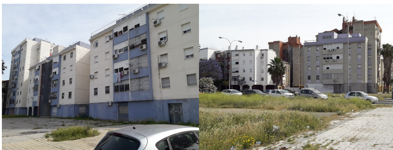
Figura 3. Edificios rehabilitados en la barriada de Las Vegas